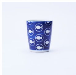
湯呑_絵柄 まだい φ80×H95mm