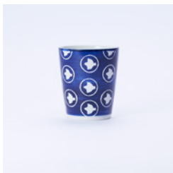
湯呑_絵柄 ひばり φ80×H95mm