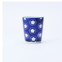
湯呑_絵柄 うめ φ80×H95mm