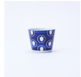
蕎麦猪口_絵柄 どんぐり φ85×H70mm