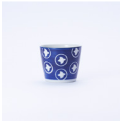
蕎麦猪口_絵柄 ひばり φ85×H70mm