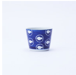
蕎麦猪口_絵柄 まだい φ85×H70mm