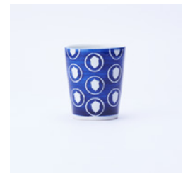
湯呑_絵柄 どんぐり φ80×H95mm