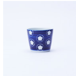
蕎麦猪口_絵柄 うめ φ85×H70mm